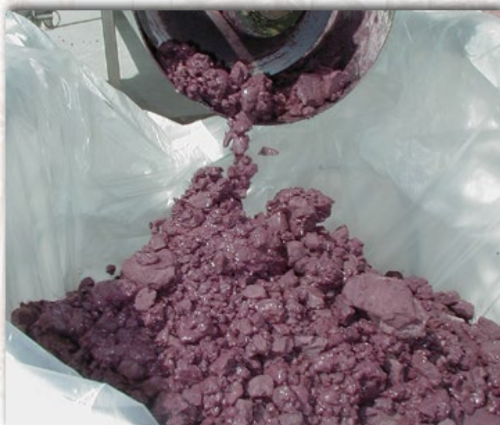
Sache interne en PE.

La jupe de fermeture permet un transport en sécurité.